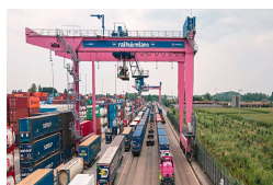
Hannibal potenzierà a febbraio il treno fra Melzo e Rotterdam