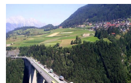
Nuovi divieti per camion in Austria il sabato